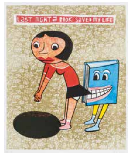
Jim Avignon Last Night a Book Saved my Life

Jim Avignon (*1968), Maler, Musiker und Konzeptkünstler, ist einer der erfolgreichsten deutschen Pop-Art-Künstler: Zur Wiedereröffnung des Berliner Olympiastadions 2004 hat er ein 2.800 m 2 großes Bild gemalt, das von 132 Sportlern ins Stadion getragen wurde. Im Oktober 2013 übermalte Avignon in einer öffentlichkeitswirksamen Aktion sein eigenes, unter Denkmalschutz stehendes Mauerbild von 1991. Zur Kasseler documenta x steuerte er, auf eigene Kappe, eine kritische Performance bei: Er malte täglich ein Bild, das er nach Vollendung sofort zerstörte. Avignon nutzt die populäre, an Comic-Figuren angelehnte Bildsprache, um kritisch auf Gegenwartsprobleme wie Bestechung und Korruption oder den Mangel an wirklicher Kommunikation in der sogenannten Informationsgesellschaft hinzuweisen.