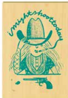
Nadine Prange Westernlady 3

Original-Serigrafie auf Holztafel, Auflage: außerhalb der Kalender-VA 10 Expl., Format: 28x19 cm € 75,- (Nichtmitglieder € 98,-) NR 049818