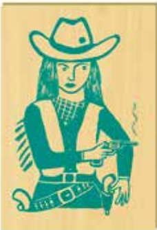
Halina Kirschner Westernlady 1

Den Kalendern 1/90 – 20/90 sind vier mit je einem Aufhänger versehene Holztafeln mit je einer signierten und nummerierten Original-Serigrafie beigegeben, die nebeneinander gehängt eine hübsche Reihe ergeben, Format: 28x19 cm, € 248,- (Nichtmitglieder € 298,-) NR 049788