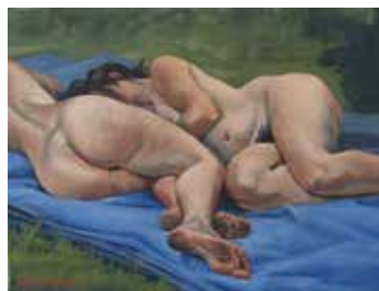
Karoline Koepfel – Schöner Hintern Öl auf Nessel, Format: 30x40 cm, signiert € 1.450,- NR 049699