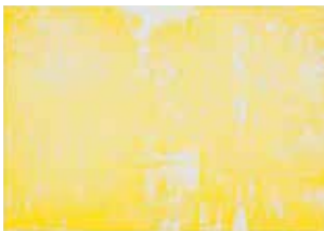
Erster Druck: gelb

Orig.-Farbradierung von 3 Kupferplatten, Bildformat: 25 x 45 cm, auf dickem Bütten: 40 x 60 cm, Auflage: 150 Exemplare, signiert und nummeriert € 228,- (Nichtmitglieder € 248,-) NR 049613