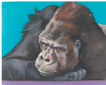
Karoline Koepfel – Ivo Öl auf Leinwand, Format: 40x50 cm, signiert € 1.450,- NR 049680