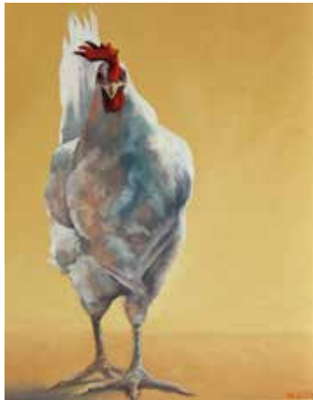
Karoline Koepfel – Huhn II Öl auf Nessel, Format: 50x40 cm, signiert € 1.450,- NR 049745