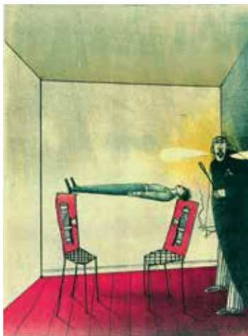
Paul Wunderlich – Hypnotisierter Knabe Orig.-Farblithografien, signiert und nummeriert € 390,- NR 049664