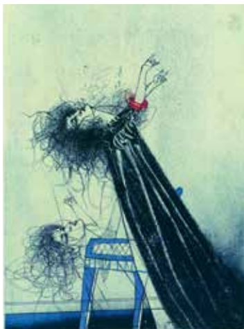
Paul Wunderlich – Signora Angiolieri III Orig.-Farblithografien, signiert und nummeriert € 390,- NR 049656

1927 Eberswalde geboren, studierte Wunderlich 1947 bis 1951 an der Landeskunstschule Hamburg, einer seiner Kommilitonen war Horst Janssen. 1961 bis 1963 lebte er in Paris. 1963 bis 1968 Professur an der Hochschule für Bildende Künste, Hamburg. Ein Skandal hatte ihn 1960 berühmt gemacht: Die Bilder seines erotischen Lithografie-Zyklus qui s'explique wurden von der Staatsanwaltschaft als unzüchtig beschlagnahmt. Das Museum of Modern Art in New York jedoch kaufte sofort den umstrittenen Zyklus. 2004 hat Wunderlich Thomas Manns Novelle Mario und der Zauberer illustriert, für jede Illustration schuf er eine großformatige Farblithografie. Drei Motive haben wir für Sie als Vorzugsausgabe zur Auswahl, aber die Grafiken sind natürlich sehr viel größer als das Buch.