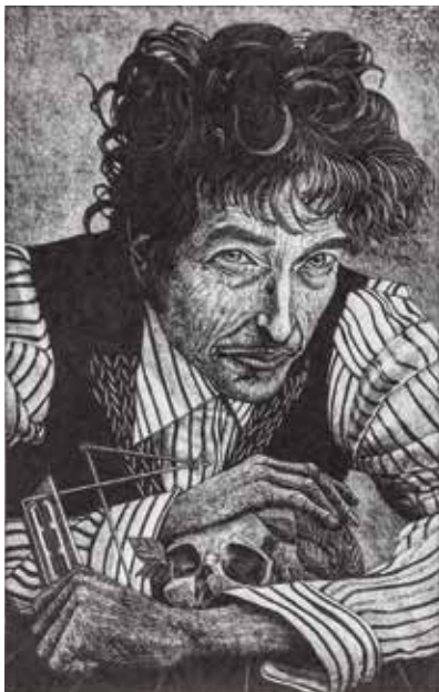
Siegfried Otto Hüttengrund Hommage à Bob Dylan Holzriss von 2 Platten, Bildformat: 52,5 x 33 cm, Papierformat: 68 x 43,5 cm, Auflage: 20 Exemplare, signiert und nummeriert € 298,- (Nichtmitglieder € 348,-) NR 049621

Der 1951 in Hohenstein-Ernstthal, Stadtteil Hüttengrund geborene Künstler hat nun nach Tom Waits und Ian Andersen als Dritten und Letzten den großen Bob Dylan für die Büchergilde portraitiert: Wie bei den beiden anderen Portraits ein ungeschminktes, nicht auf Heldenverehrung zielendes Portrait eines älter gewordenen Idols. Hüttengrund studierte 1976–79 an der Hochschule für Bildende Künste Dresden und entwickelte ab 1980 für sich eine spezielle Holzrisstechnik: Er kratzt mit der Radiernadel in den Lack furnierter Holzplatten aus alten Möbeln.