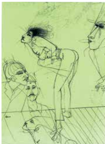
Paul Wunderlich – Giovannotto zeigt Zunge und hat Bauchweh Orig.-Farblithografien, signiert und nummeriert € 390,- NR 049648