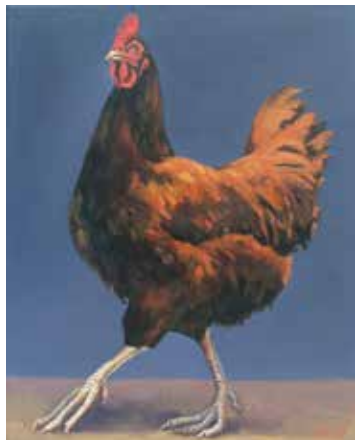
Karoline Koepfel – Lohmann Öl auf Leinwand, Format: 50x40 cm, signiert € 1.450,- NR 049729

Die Genießer des diesjährigen Taborkalenders erfreuen sich besonders an einer Lithografie mit einem Huhn, das mehreren Männern schwere Rätsel aufgibt. Nun hat es das Huhn auch ölig auf die Leinwand geschafft, in seiner ganzen prachtvollen Individualität von Karoline Koepfel portraitiert. Der 1962 in Berlin geborene Spross eines Malerpaars studierte 1981 – 1988 bei Klaus Fußmann an der Hochschule der Künste Berlin, wo sie ab 1990 auch Meisterschülerin war, ebenso freie Malerei wie 1989 – 1990 bei Manfred Bluth an der Gesamthochschule Kassel. In Karoline Koepfels Malerei tauchen immer wieder Tiere auf, und das sind immer Individuen, wie der Gorilla Ivo, den sie im Berliner Zoo portraitiert hat.