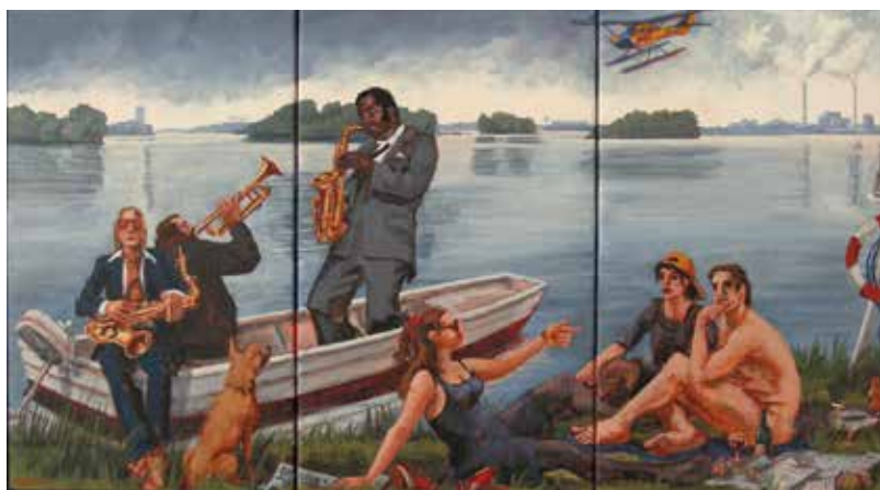
Karoline Koepfel – Spreeufer bei Strahlau Acryl auf Leinwand, Triptychon, Format: 50x90 cm, signiert € 2.700,- NR 049702