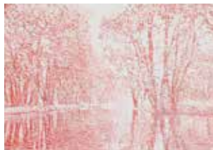
Zweiter Druck (an sich auf gelb, hier zur Demonstration einzeln)