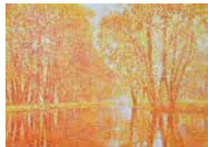
Rot und gelb ergeben den 2. Zustand