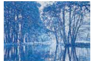
Blau wird als letztes auf gelb/rot gedruckt und ergibt die Grün- und Brauntöne

Jede Druckplatte entsteht durch wochenlanges, freihändiges Tupfen des Künstlers mit dem Pinsel. Der gelbe Druck wird auf die Platte für Rot aufgedruckt, so dass der Künstler beim Arbeiten sieht, wo im Bild schon gelb steht.