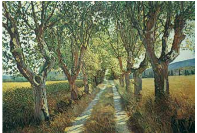
Günther Hermann – Platanenallee

Orig.-Farbradierung von 3 Kupferplatten, Bildformat: 35 x 50 cm, auf dickem Bütten: 50 x 65 cm, Auflage: 150 Exemplare, signiert und nummeriert € 228,- (Nichtmitglieder € 248,-) NR 049605