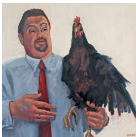
Karoline Koepfel – Hühnerhalter Öl auf Leinwand, Format: 50x50 cm, signiert € 1.450,- NR 049710