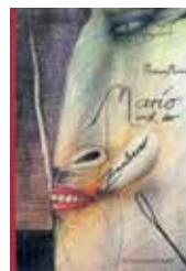
Thomas Mann/ Paul Wunderlich Mario und der Zauberer Ein tragisches Reiseerlebnis Mit 17 ganzseitigen Illustrationen nach Original-Lithographien von Paul Wunderlich, 104 Seiten, Format: 28,7 x 20,5 cm, Edelpappband mit Fadenheftung

Büttenformat: je 65 x 50 cm, Auflage: je 40 Exemplare, Druck: Ernst Hanke, Ringgenberg/Schweiz