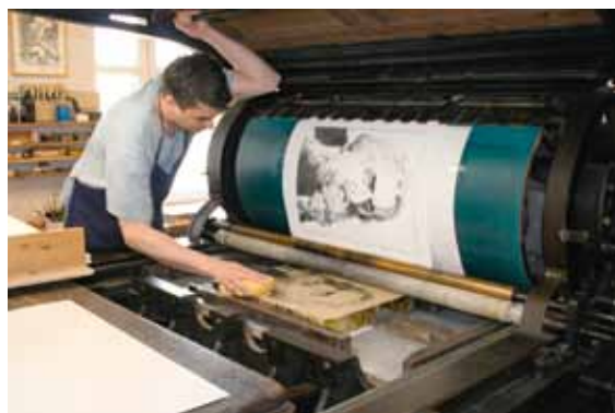
... der erste Abzug vom Stein in der Tabor Presse