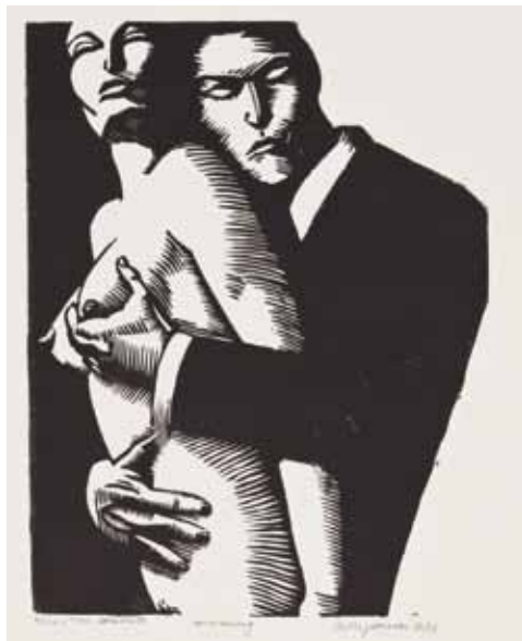
Leon Janssen De omhelzing

Leon Janssen wurde 1951 in Stein geboren, studierte 1969 – 1974 an der Stadsacademie Maastricht und lebt in Holland und Belgien als freischaffender Künstler. Ausstellungen u.a. in der „Gesellschaft für aktuelle Kunst Bremen“ (1984), im Singermuseum Laren (1988), im National Theatre London (1994), im Gemeindemuseum Erfurt (1995) und im Haus der Kultur München (1996). Als Buchillustrator gestaltete er für Cees Noteboom den Buchumschlag von de geliefde gevangene . Auf Deutsch heißt der Titel seines Holzschnittes: Die Umarmung .