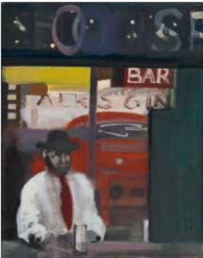
Reinhard Stangl – Gin Bar Öl auf Leinwand, ungerahmt, 50 x 40 cm, rücks. signiert € 2000,- NR 047998

rechts: Reinhard Stangl Stadtsplitter II Öl auf Leinwand, ungerahmt, 47 x 42 cm, rücks. signiert € 2000,- NR 048005