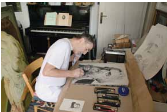
Grützke bezeichnet den Stein seitenverkehrt

(lithos = griechisch: Stein) Gezeichnet wird mit rußhaltigem Fettstift auf eine vollkommen plan geschliffene Steinoberfläche von Solnhofener Kalkschiefer. Die Steinplatten sind 10 – 15 cm dick und ab einer bestimmten Größe nur mit einem Kran zu bewegen. Der Stein hat die Eigenschaft, in feinsten Poren sowohl Fett als auch Wasser zu speichern. Gezeichnet wird natürlich spiegelverkehrt. Die nicht bezeichneten Teile des Steines werden durch Auftragen von Gummiarabikum fettabweisend beschichtet. So haftet die mit einer Lederwalze aufgetragene Druckfarbe nur auf den bezeichneten Teilen des Steines. Für den Druck wird Büttenpapier auf den Stein gelegt, auf das dieser durch Reiben oder Walzen mit großem Druck die Zeichnung seitenrichtig abgibt. Bei der Farblithografie muss dieser Vorgang für jede Farbe einzeln wiederholt werden. Wie viele Abzüge von einem Stein möglich sind, hängt stark von der Zartheit der Zeichnung und dem Können der Drucker ab.