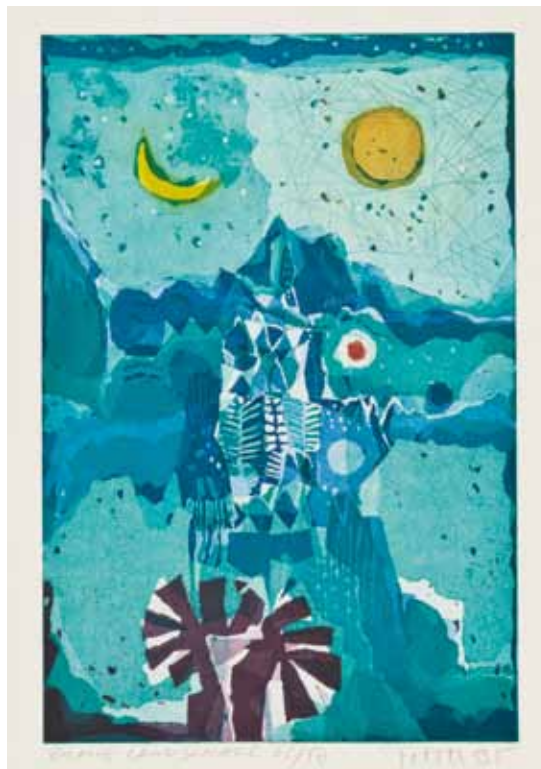
Alfred Pohl – Blaue Landschaft

Farbradierung 1995, Druck: Gert Schegulla +, Möhnese, Bildformat: 25 x 35 cm, Bütten: 40 x 50 cm, Signiert und nummeriert, € 248,- (Nichtmitglieder € 300,-) NR 04803X