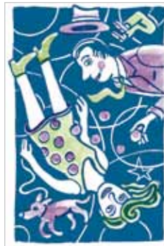
Halina Kirschner Aufhebung der Gravitation NR 04686X