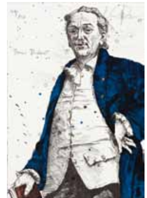
Erhard Göttlicher Diderot

€ 90,- (Nichtmitglieder € 118,-) NR 180421