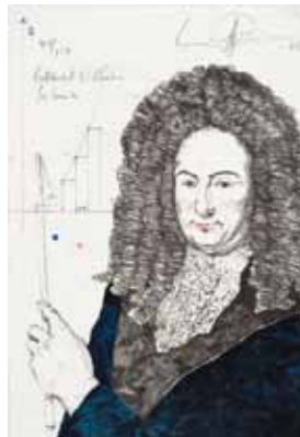
Erhard Göttlicher Leibniz

€ 90,- (Nichtmitglieder € 118,-) NR 180448