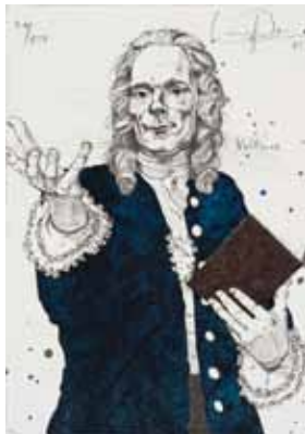
Erhard Göttlicher Voltaire

€ 90,- (Nichtmitglieder € 118,-) NR 18043X