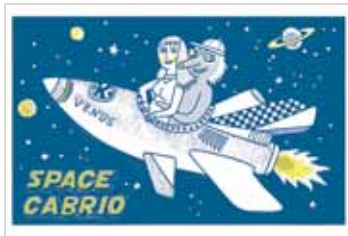
Katja Spitzer Space Cabrio NR 046886

Original-Serigrafie, handkoloriert, Bildformat: 40 x 25 cm, Papierformat: 50 x 35 cm, Auflage: 20 arabisch nummerierte Exemplare, signiert, jeweils € 128,- (Nichtmitglieder € 178,-)