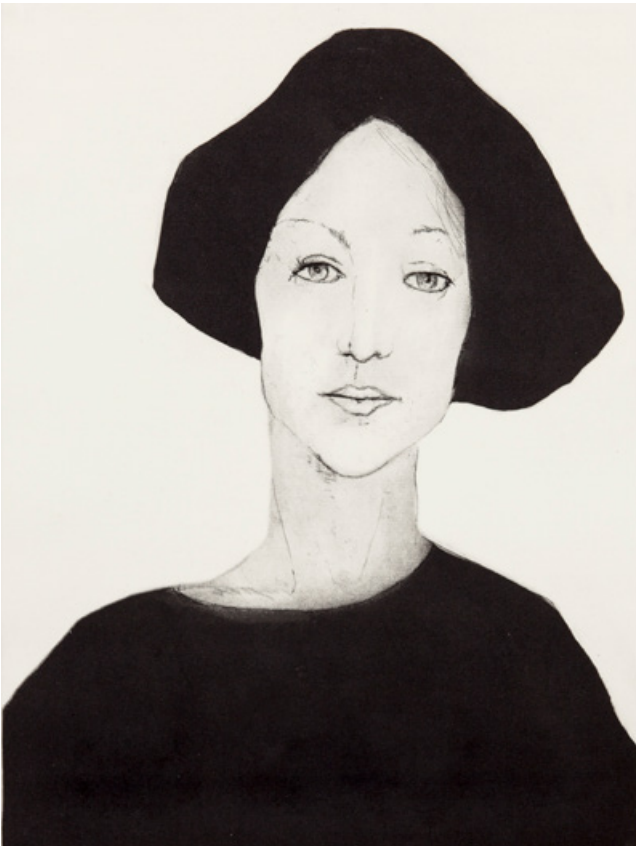
Uwe Golk - Stille

Acryl auf Leinwand, 100 x 80 cm, signiert € 1900,- (Nichtmitglieder € 2200,-) NR 052436