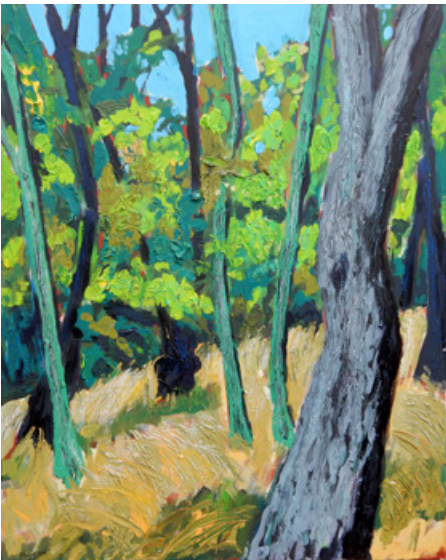
Peter Zaumseil - Im Stadtwald

Acryl auf Leinwand, 100 x 80 cm, signiert € 1900,- (Nichtmitglieder € 2200,-) NR 052428