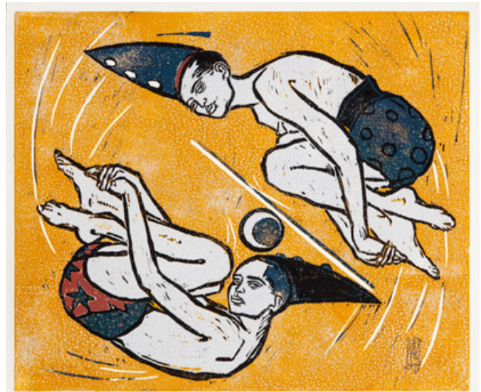
Dagmar Zemke - Luftnummer

Orig.-Lithografie, 32 x 44 cm, Büttlen 59 x 41 cm, Auflage: 40 Exemplare, signiert und nummeriert, Druck: Tabor Presse Berlin € 228,- (Nichtmitglieder € 278,-) | NR 04364X