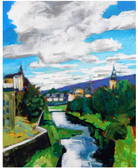
Peter Zaumseil - Wolken über der Stadt

Peter Zaumseil, 1955 in Greiz im Vogtland geboren, war das Künstlerleben nicht in die Wiege gelegt: Er absolvierte zunächst eine Metallerlehre, forcierte aber zielstrebig auf eigene Faust eine zeichnerische und malerische Ausbildung: 1979 bis 1986 an der Spezialschule für Malerei und Grafik in Rudolstadt, 1984 bis 1989 durch Lehrgänge bei Günther-Albert Schulz und Wolfram Ebersbach in Leipzig, 1987 bis 1989 in der Förderklasse Malerei/Grafik in Gera. 2002 wurde er mit dem Christoph-Graupner-Kunstpreis ausgezeichnet. Peter Zaumseil lebt und arbeitet in Elsterberg (Vogtland).