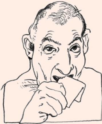
Zeichnung Johannes Grützke aus Heinrich v. Kleist Michael Kohlhaas

Immer wenn ich ihm in seinem Atelier in Berlin-Schöneberg gegenüber saß, zuletzt Anfang vergangenen Jahres, als er bereits von seiner Krankheit gezeichnet war, verspürte ich eine Mischung aus Faszination, Ehrfurcht und Verlegenheit. Verlegenheit, weil ich dachte, was ist das für ein großzügiger Mensch, der mir Stunden seiner wertvollen Zeit opfert für ein launiges Gespräch über vieles und jenes, einfach nur so, und dem ich bei seiner grandiosen Bildung und seinem unerschöpflichen detaillierten Wissen zu allem, worüber er sprach, nicht das Wasser reichen konnte. Er war ein Forscher!